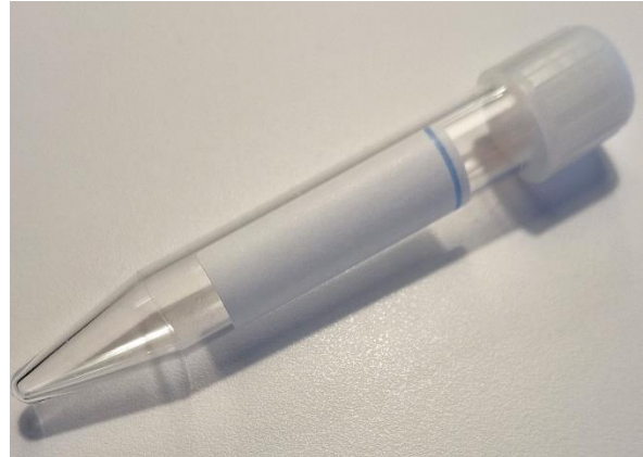
Prøveglas med strekkode.