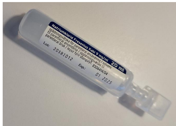
Flaske med sterilt saltvand.